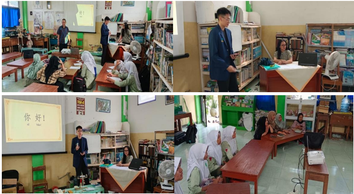
Gambar 2. Kegiatan Pengabdian MAG Skim Iptek Bagi Masyarakat (IbM)

Dengan demikian, secara kuantitatif dan kualitatif, kegiatan pendampingan Bahasa Mandarin di MTs Wahid Hasyim Desa Kucur Malang dapat dinyatakan efektif dalam meningkatkan kompetensi profesional guru.